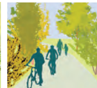
Noue, prairie urbaine