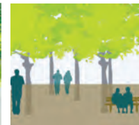
Noue, prairie urbaine