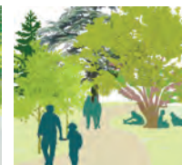
Noue, prairie urbaine