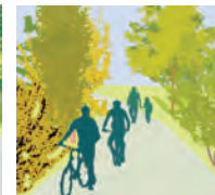
Noue, prairie urbaine