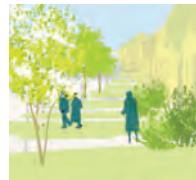
Berge de cours d'eau