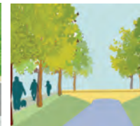
Noue, prairie urbaine