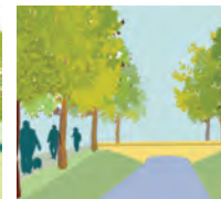
Noue, prairie urbaine