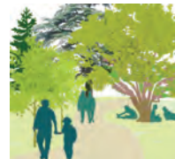
Berge de cours d'eau